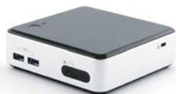
Mini PC Plug&Play

Afin de rendre vos vitrines interactives, Sequeris propose une solution complète :