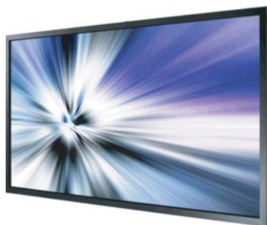
Ecran à luminosité augmentée